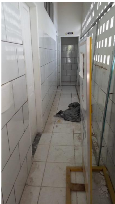
Imagem 09 – Acesso aos banheiros e copa do auditório.

O acesso e o direcionamento aos aparelhos deverão ser instalados de forma correta e como manda os requisitos normativos vigentes.