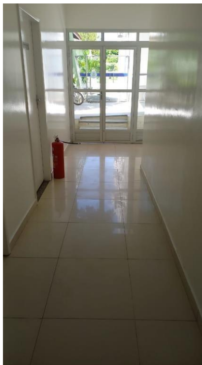
Imagem 05 – Corredor de acesso aos gabinetes com porta de saída para a rampa.