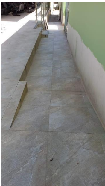
Imagem 06 – Acesso a rampa do auditório.

Ao fundo do prédio dos gabinetes deverá ser aplicada uma faixa de piso tátil que direcione os usuários da porta de saída até o início da rampa que dá acesso ao auditório e plenária da Casa.