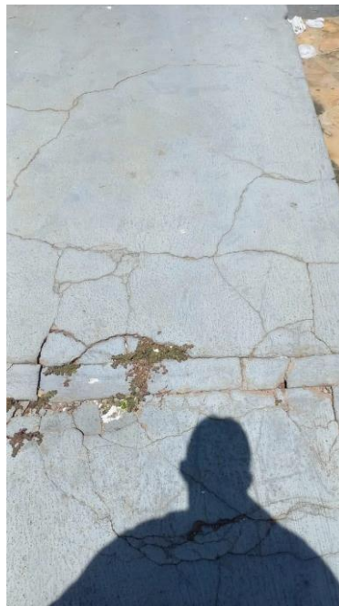
Imagem 02 – Rampa de acesso principal danificada e sem direcionamento tátil.