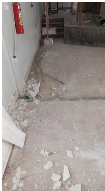
Imagem 11 – locação da rampa de acesso a plenária.