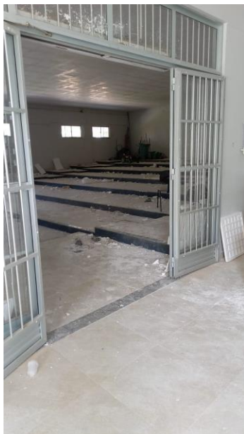
Imagem 10 – Porta de entrada do auditório.