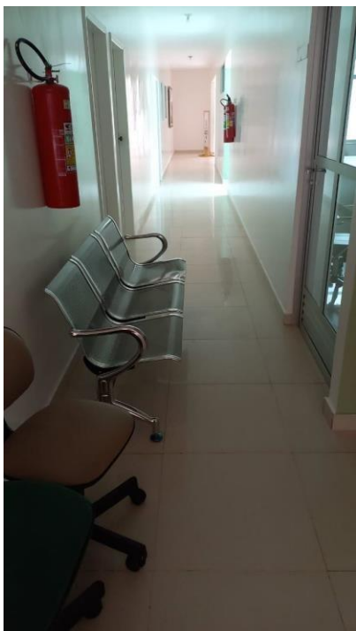
Imagem 04 – Corredor de acesso aos gabinetes