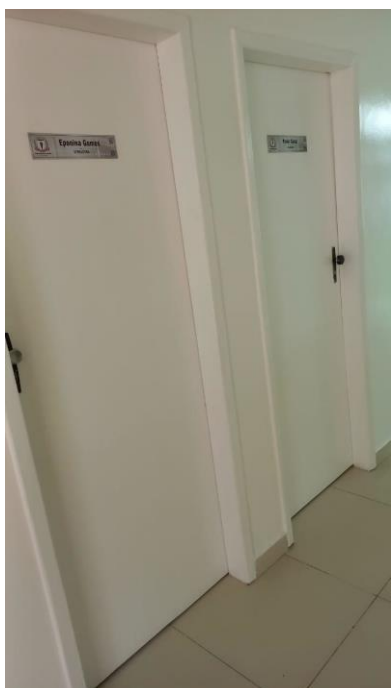
Imagem 12 – Portas sem identificação em braile.

No auditório, sala do presidente, e sala de reunião deverá ser instalada uma placa com 25x15 cm de dimensões. Nas demais salas, banheiros e acessos, deverá ser instaladas 27 placas com dimensões iguais a 28x8 cm.