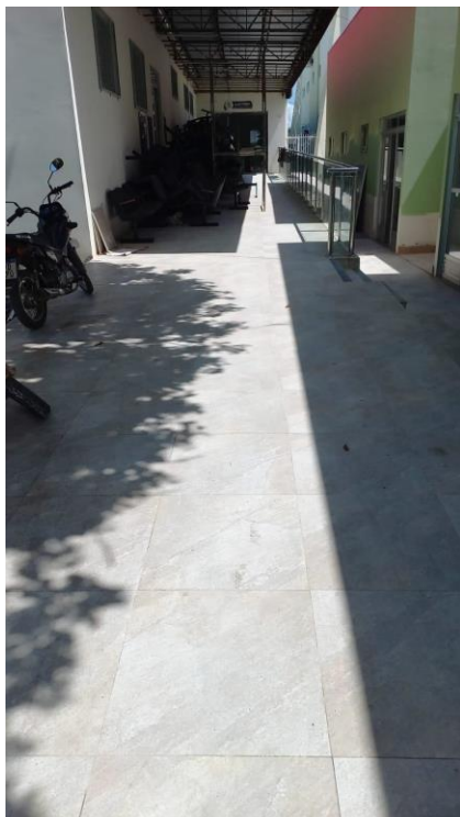
Imagem 07 – Rampa de acesso ao auditório.