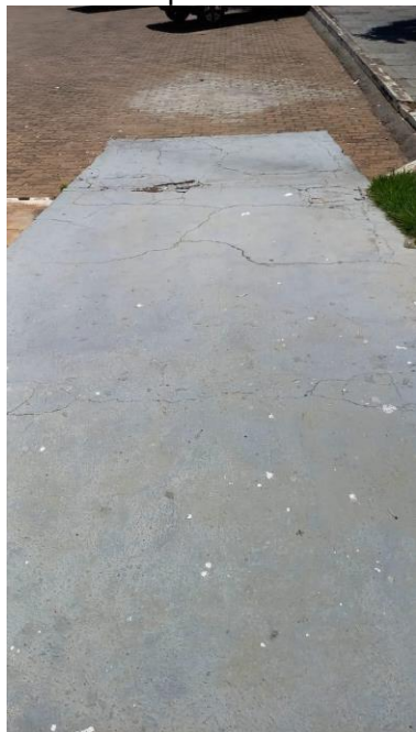
Imagem 01 – Rampa de acesso principal danificada e sem direcionamento tátil.

Deverá ser aplicada pintura em tinta para piso sobre toda a área da rampa, na cor concreto padrão.