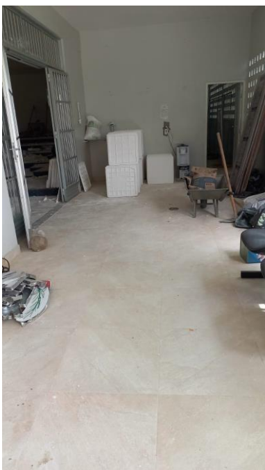
Imagem 08 – Hall de entrada do auditório.

Deverá ser instalada o piso tátil que direcione os usuários para o acesso ao auditório, aos banheiros e copa do auditório e identifiquem todas as mudanças de direção e portas do ambiente.