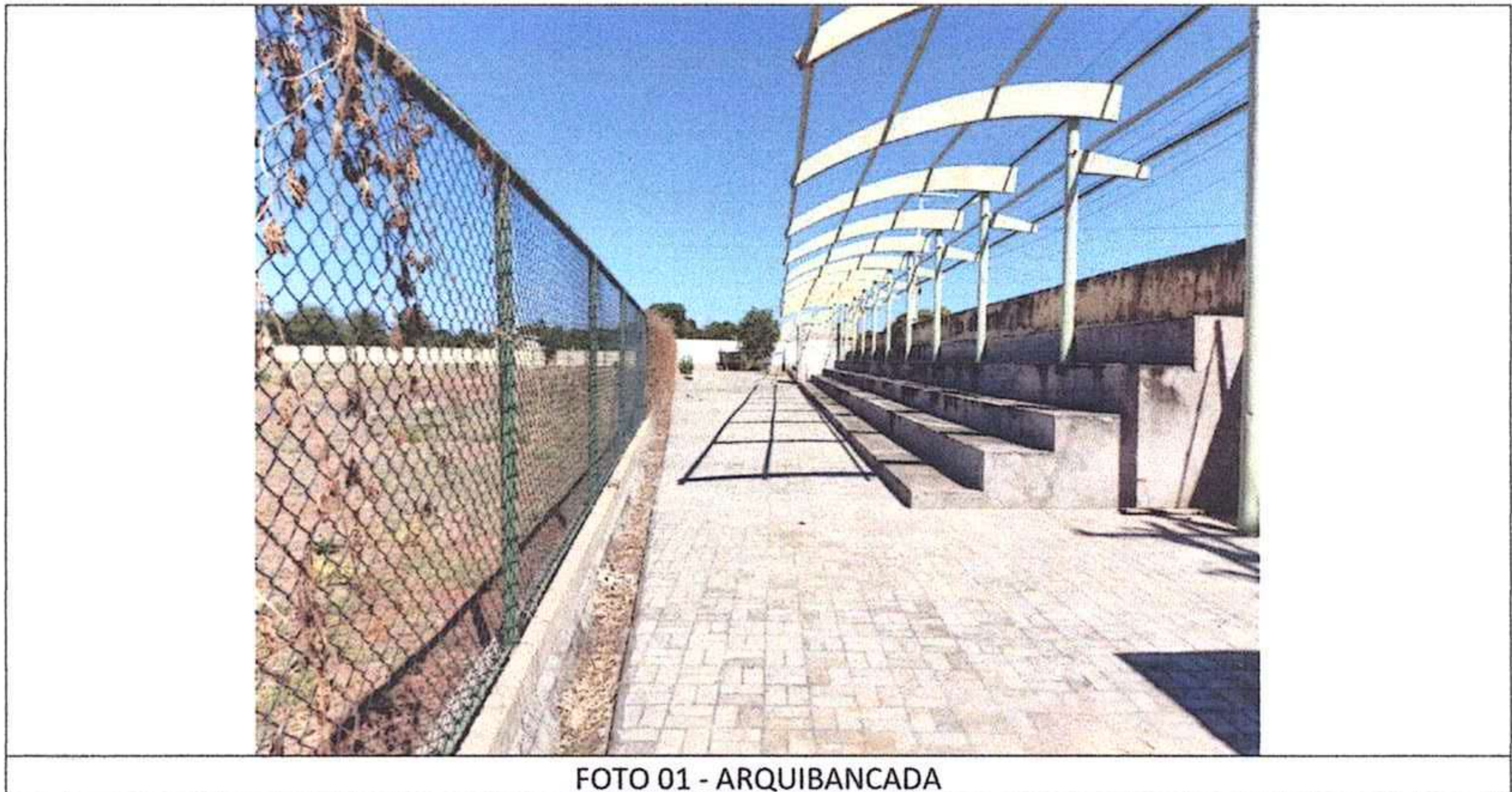
FOTO 01 - ARQUIBANCADA